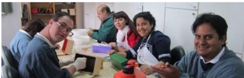
Realización compartida de actividades familiares