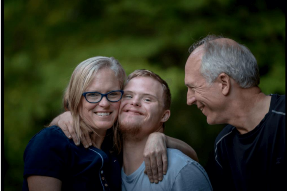
Base matrimonial sólida