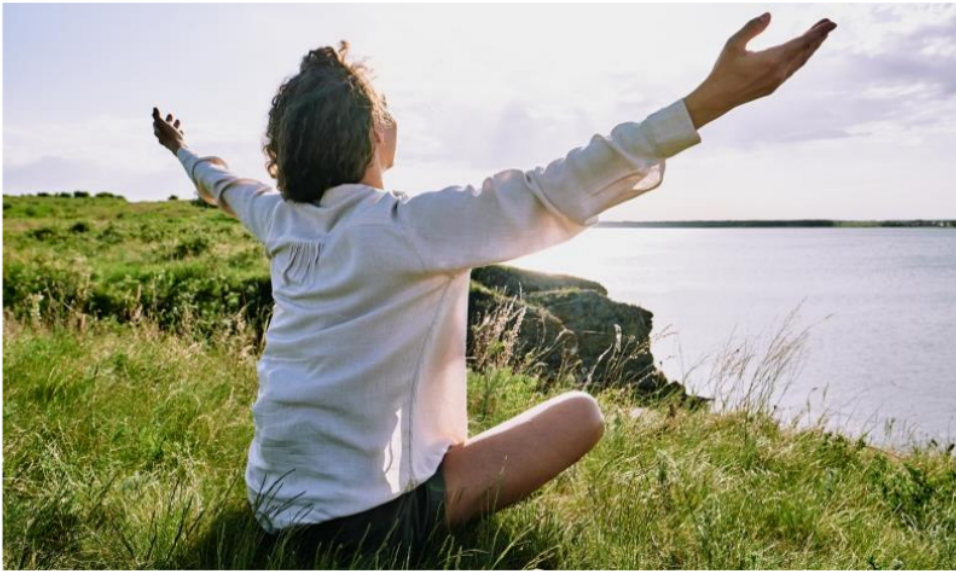
Actividades individuales de beneficio personal