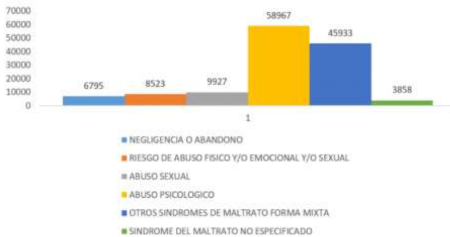
Casos atendidos en los EESS por violencia contra las mujeres e integrantes del grupo familiar (enero-septiembre 2020)