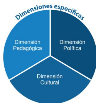
Figura 2. Dimensiones específicas de la docencia

Dimensión cultural. Esto hace referencia a la necesidad de contener un vasto conocimiento de distintos medios que permitan afrontar retos de índole económico, político, social y cultural, también los de la historia y los desafíos que existen en los medios locales, regionales, nacionales e internacionales. Para esto involucra examinar la evolución, los dilemas y desafíos con el fin de entenderlos y conseguir los conocimientos contextualizados que cada colectividad ofrece para su descendencia de menor edad.