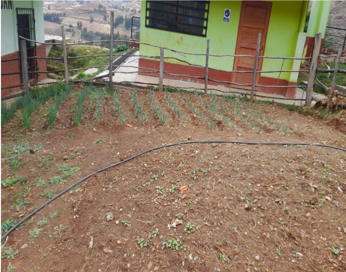
Niños de primer grado deshierbando la cebolla.