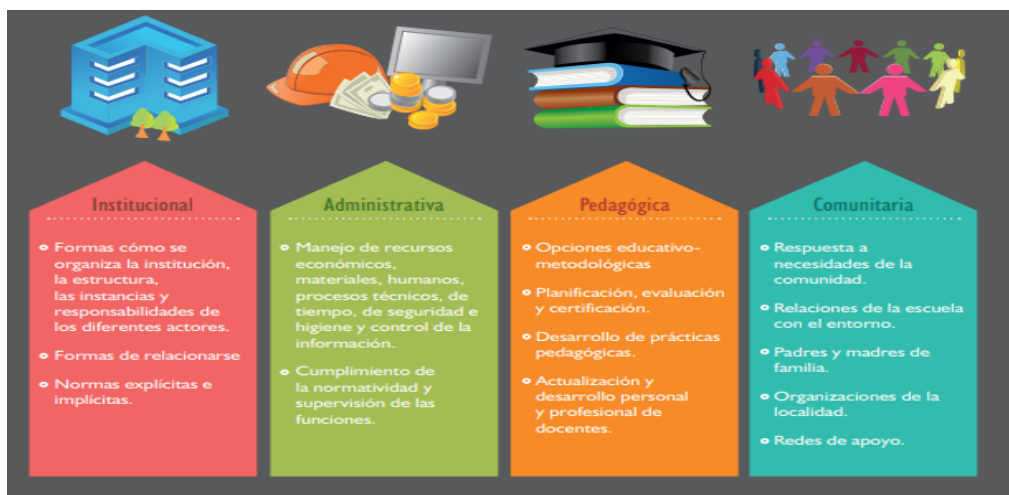
Figura 1 Dimensiones de la gestión educativa

Nota: Tomado de Manual de Gestión para Directores de Instituciones Educativas MINEDU (2011) Dimensiones de la variable Gestión Educativa