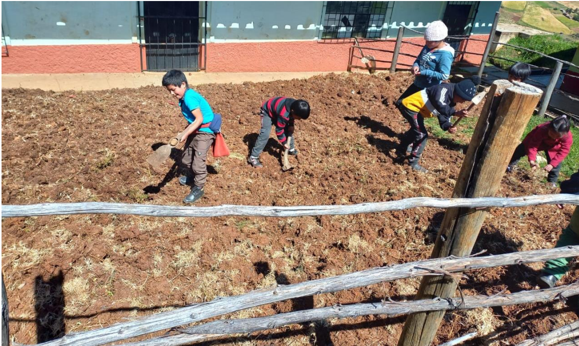
Preparación del terreno, quema de grama y arreglo de cerco.