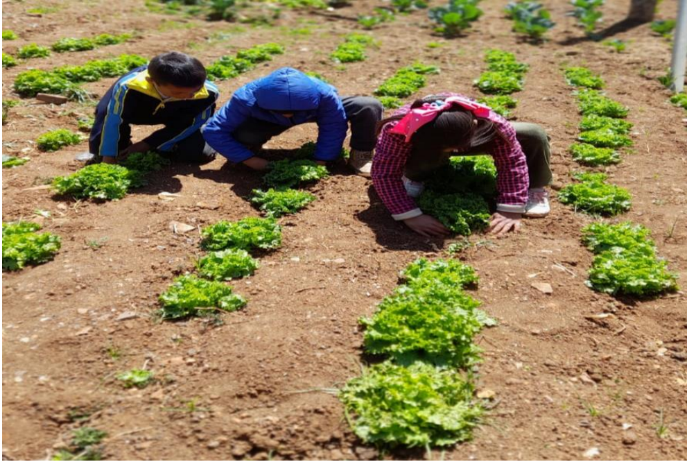
Lechuga y rabanito dos semanas después del trasplante.