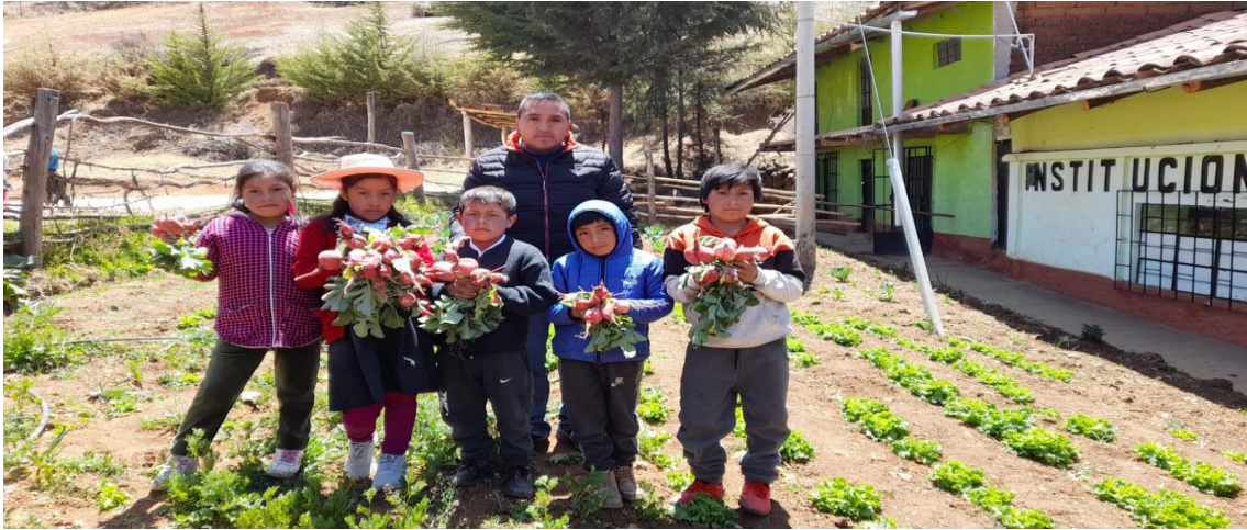
Niños de la Institución Educativa y el docente asesor observando el Biohuerto.