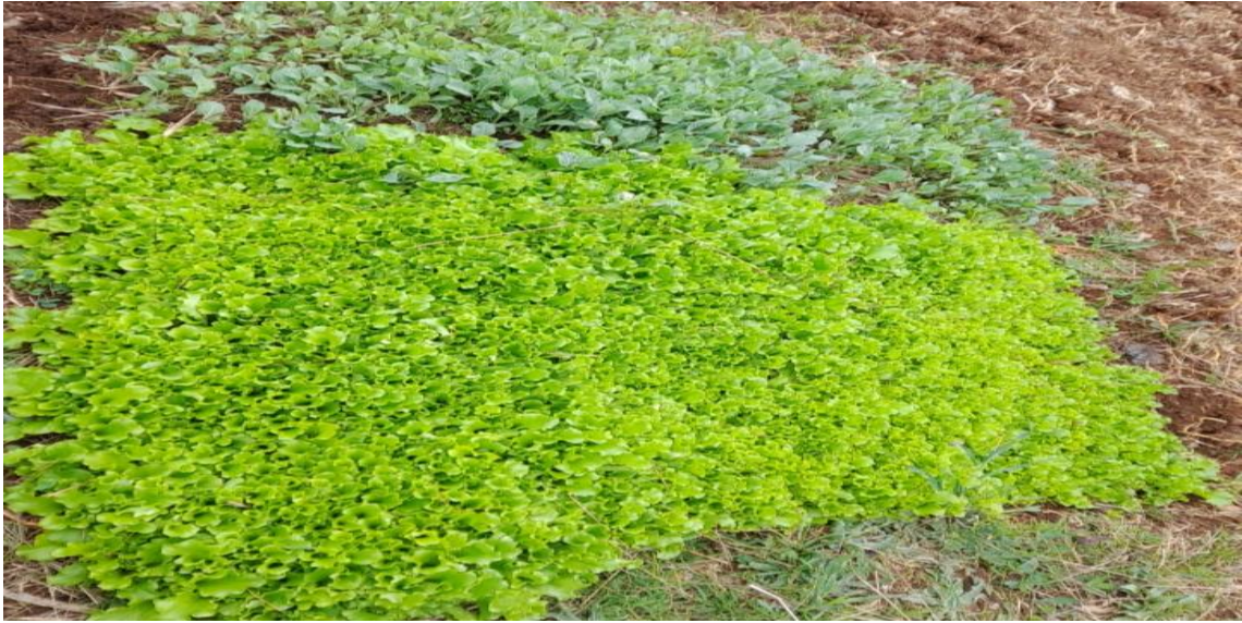
Siembra de cebolla y rabanito (después de una semana)