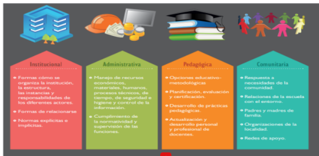
Figura 1 Dimensiones de la gestión educativa

Nota: Tomado de Manual de Gestión para Directores de Instituciones Educativas