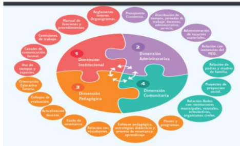
2 Figura 2 Dimensiones de la Gestión Educativa

Nota: Tomado de Manual de Gestión para Directores de Instituciones Educativas MINEDU (2011)