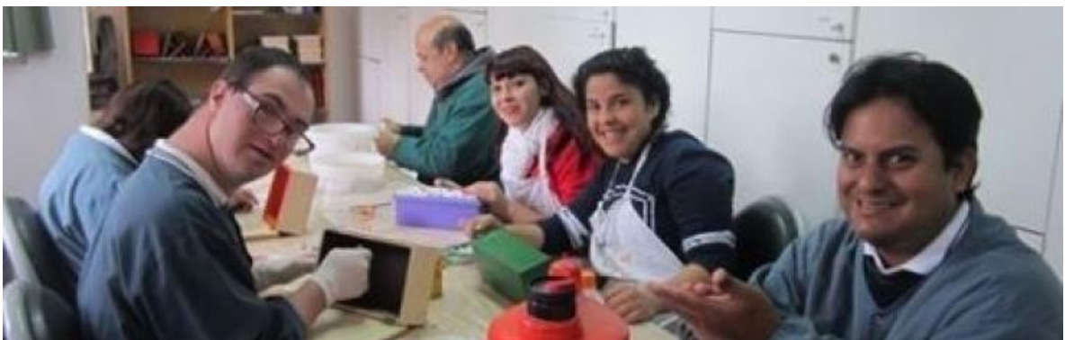
Realización compartida de actividades familiares