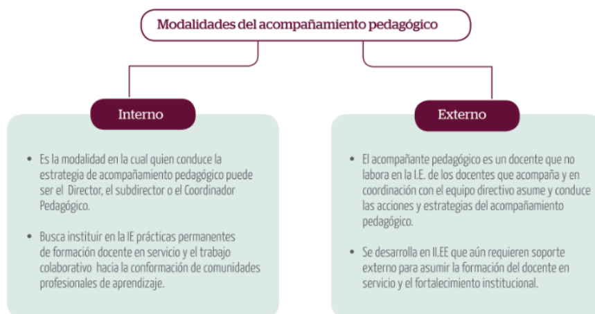
Modalidades del acompañamiento pedagógico