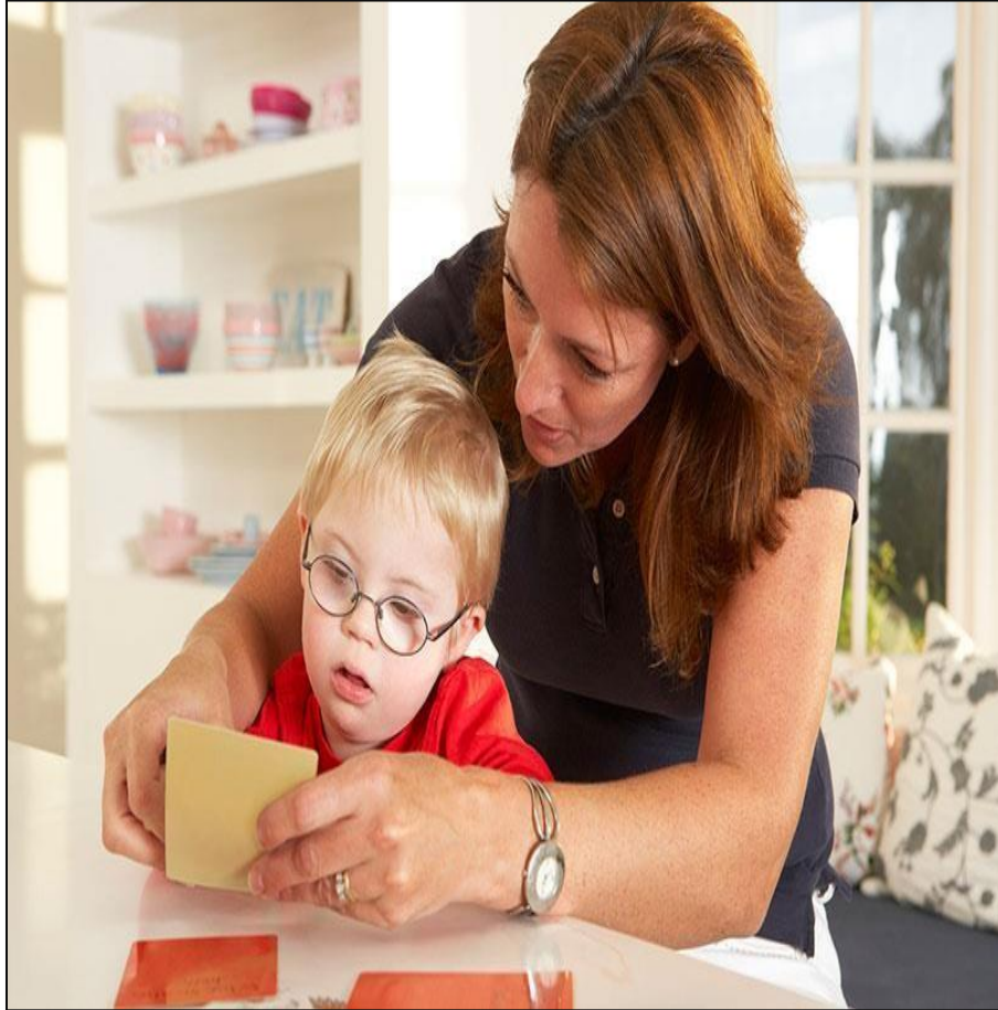
Anexo 1. Organización semántica. Tomado de Asociación Niños con Síndrome de Down (2022).