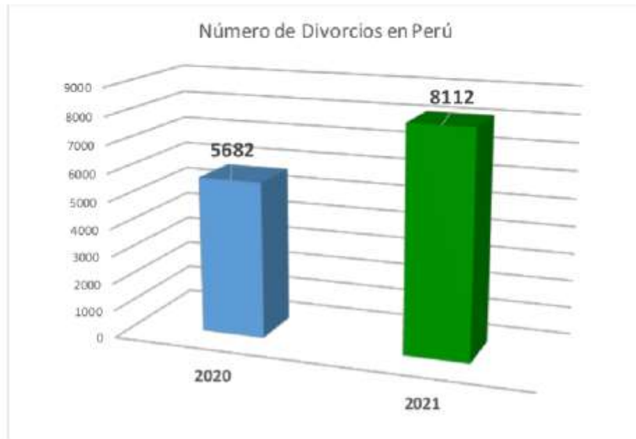
Gráfico de las estadísticas del Divorcio en Perú.